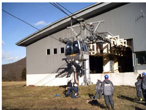
第2 Gondolaリフト救助訓練