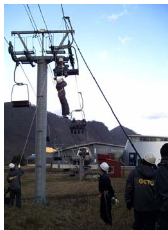
第2 ペアリフト救助訓練